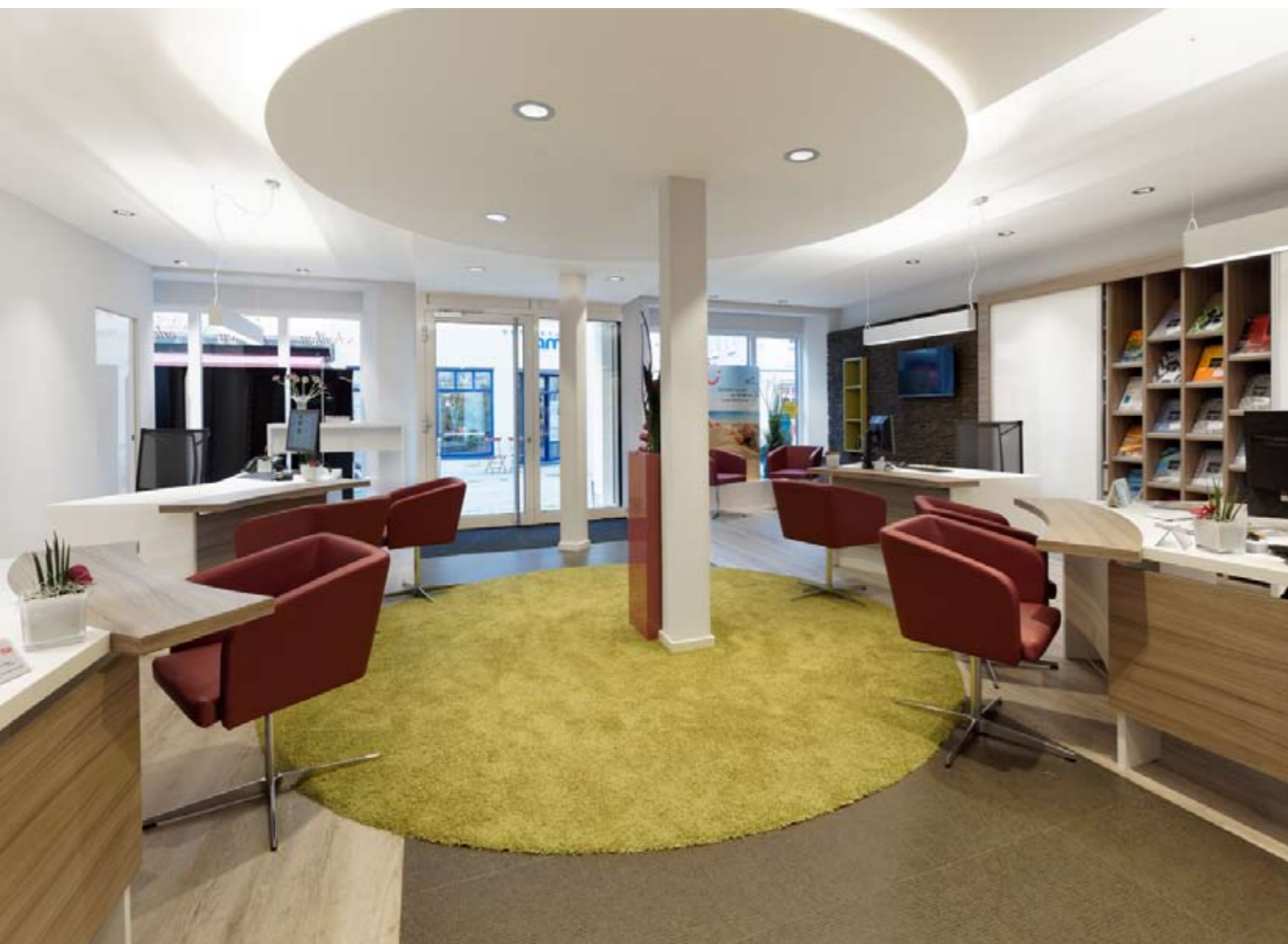
Ein markanter „Mittelpunkt der Reisewelt“: Die einzelnen Beratungsplätze gruppieren sich einladend im Kreis.

Reisebüros müssen sich heute neu positionieren und präsentieren. Die massive Konkurrenz über das Internet zwingt sie über Qualitäten und Alleinstellungsmerkmale nachzudenken und diese auch in der Innenarchitektur auszudrücken. So ging es bei dieser Aufgabenstellung darum, die hohe Beratungskompetenz des Reisebüros zu kommunizieren, Vorfreude auf das Reisen zu wecken sowie ein Wohlfühlambiente für die Kunden zu schaffen.